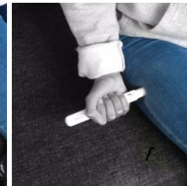
Appuyez fermement et maintenez appuyé pendant 5 secondes