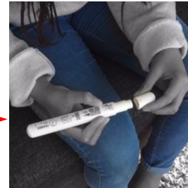
Enlevez le bouchon blanc