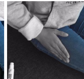
Puis massez la zone d'injection